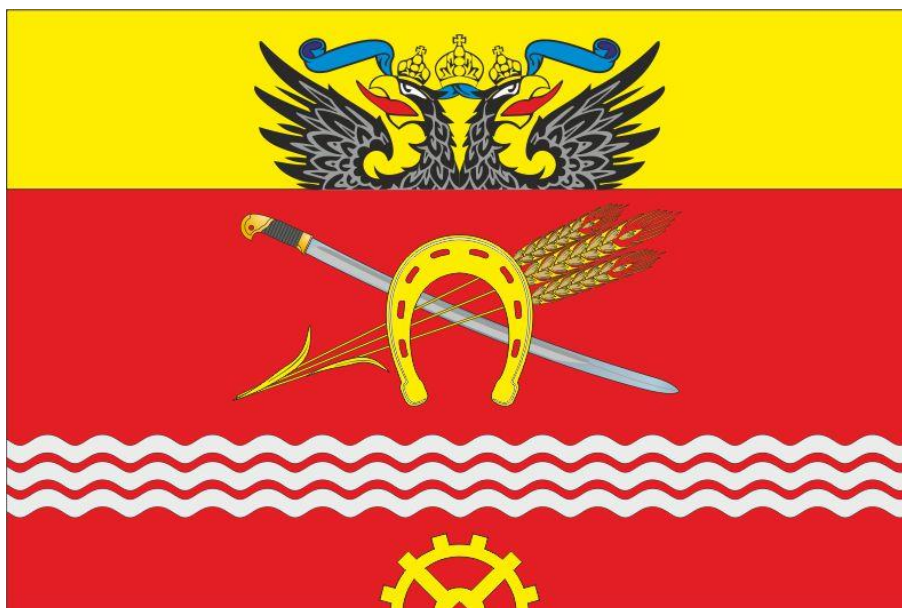
РИСУНОК ФЛАГА МУНИЦИПАЛЬНОГО ОБРАЗОВАНИЯ «ГРУШЕВСКОЕ СЕЛЬСКОЕ ПОСЕЛЕНИЕ»

Приложение 2 к решению собрания депутатов Грушевского сельского поселения от 19.02.2019 года № 129