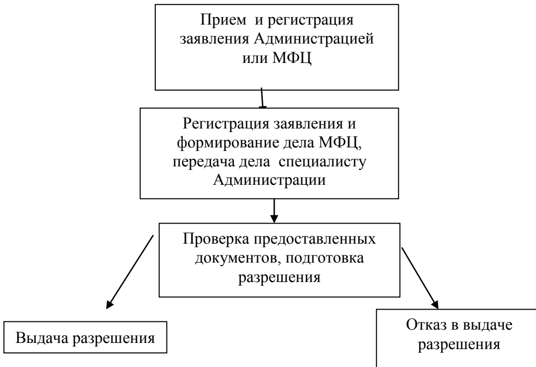
Блок-схема последовательности выполнения административных процедур исполнения муниципальной услуги «Выдача разрешения на ввод объекта в эксплуатацию»